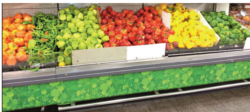
Diversidad de pimientos en un supermercado (Fotografía de Zachi Evenor y MathKnight. Reproducida bajo licencia CC BY 3.0).

descubrimiento pone de manifiesto por primera vez la transferencia de RNA funcionales entre reinos y deja una puerta abierta a la posibilidad de que pequeños RNA derivados de virus de plantas pudieran interferir en el metabolismo de células humanas. En cualquier caso, hoy por hoy, no existen evidencias de que los virus de plantas sean los agentes causales de ninguna enfermedad en el hombre u otros mamíferos. Los problemas que los virus de plantas nos causan permanecen en el ámbito, poco desdeñable, de las graves pérdidas económicas que ocasionan a cultivos clave para nuestra subsistencia. Es pertinente recordar que en amplias zonas del mundo todavía hoy en día muere más gente de desnutrición que de infecciones provocadas por virus.